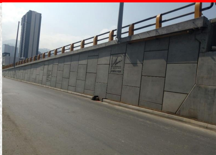
Intercambiador Vial Calle 77 Medellín