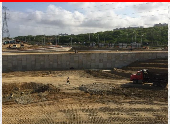
Alameda del Río - Barranquilla